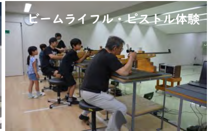
ビームライフル・ピストル体験

来館数、合計687名の大盛況となり、 体育館内から子供たちの元気な声 が聞こえてきました。 次回は、10月14日スポーツの日の 無料公開日にお待ちしています！